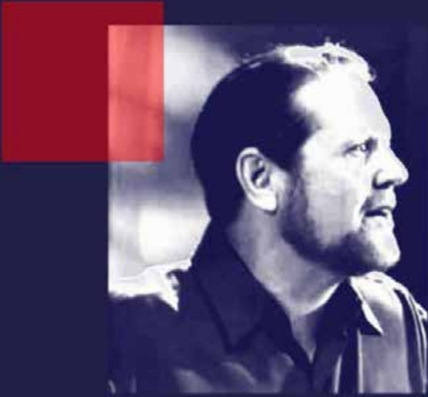
متن دو سخنرانی باب آواکیان، تابستان ۲۰۱۸ ترجمه از حزب کمونیست ایران (م ل م)

امکان آن فراهم شود که این واحدهای رزمی در درون نیروهای انقلابی «ذخیره» که وسیع تر هستند «آب شوند» و هم زمان شرایط فعال ماندن آن ها، تعلیمات بیشتر و آغاز عملیات دیگر علیه دشمن آفریده شود.